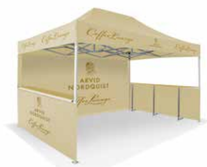
4,5 x 3 m