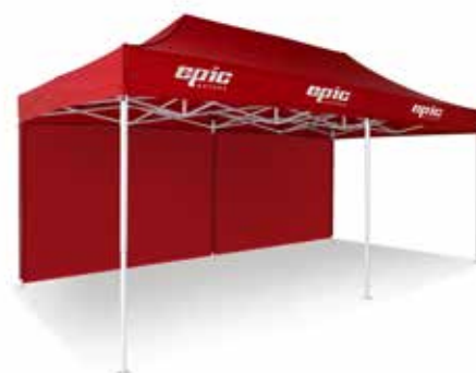
6 x 3 m

Event-tält av hög kvalitet – stabila & enkla att sätta upp