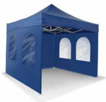
3 x 3 m