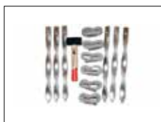
Kit för fastsättning