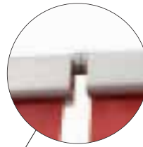
Expand's patentierter Magnetic Connector